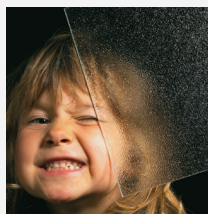
Ornament 504 weiß