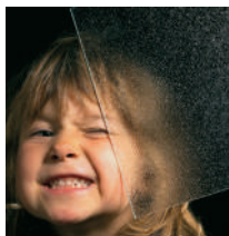
Ornament 504 weiß